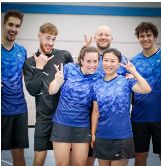
Die 1. Mannschaft am ersten Spieltag der Saison.

Die 4. Mannschaft konnte ebenfalls punkten: Trotz schwieriger Bedingungen – unter anderem einer niedrigen Hallendecke – sicherte sie sich in Uttenreuth ein hart erkämpftes Unentschieden.